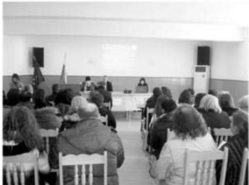
нансовата подкрепа на Оперативна програма „Развитие на човешките ресурси“ съфинансирана от Европейския социален фонд на Европейския съюз.

„Настоящият документ е изготвен с финансовата помощ на Европейския